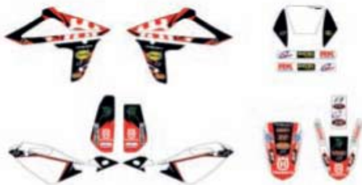
COD. HMGRSMR09 Kit adesivi replica SMR Replica graphic Kit SMR