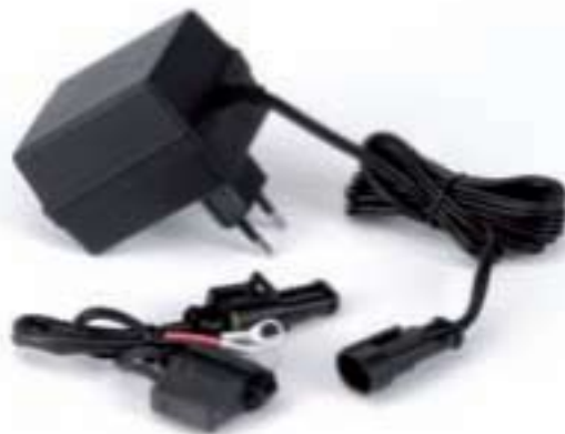
COD. 6000H1103 Carica batteria Battery charger