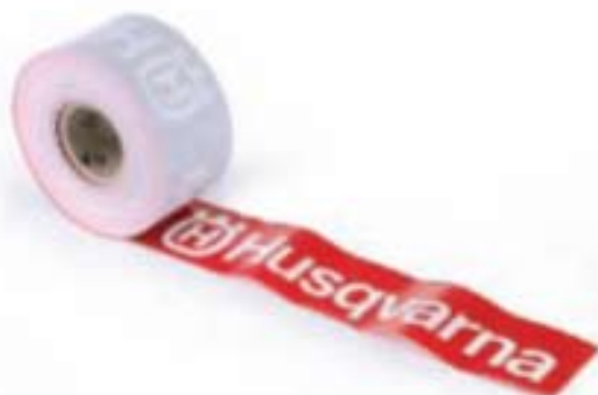
COD. HV004R Rotolo fettuccia rosso Red truck tape