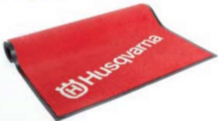
COD. HMCARPET01 Tappeto racing Racing carpet