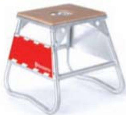
COD. HM5TAND Cavaletto in alluminio Aluminum stand