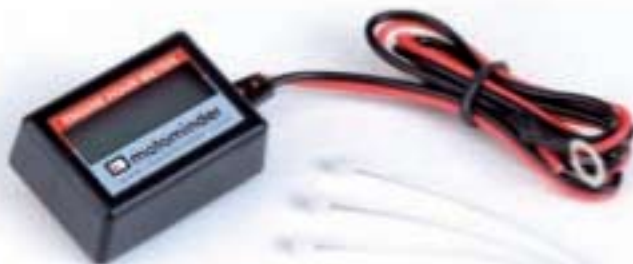
COD. 6000A9946 Conta ore motore Engine hour meter