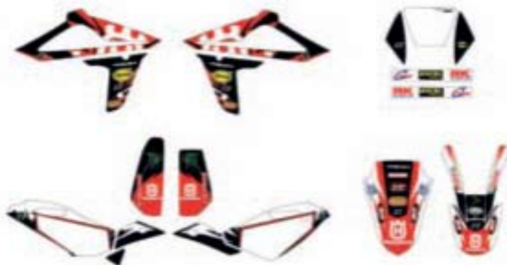
COD. HMGRTE09 Kit adesivi replica TE Replica graphic Kit TE