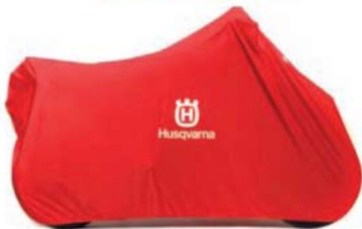
COD. HMC0B101 Telo coprimoto Protective cover indoor